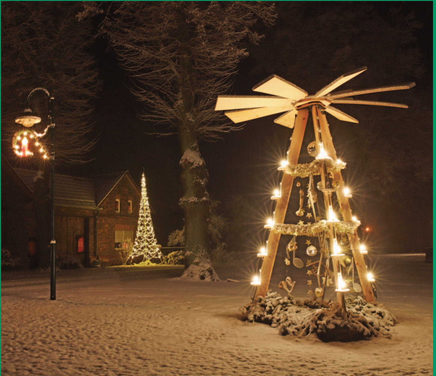
Lindenallee in Klein Partwitz, Dezember 2021